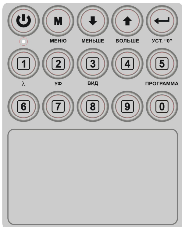
Рис. 1 Клавиатура спектрофотометрического детектора UVV-105.